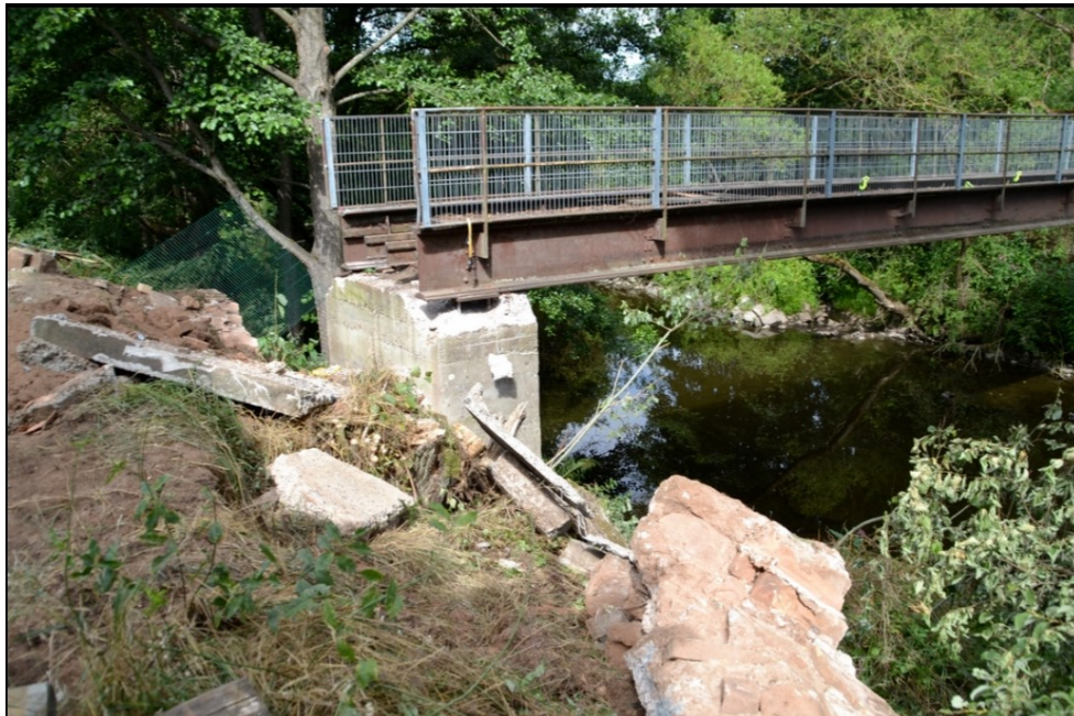
Freigelegtes nördliches Brückenlager