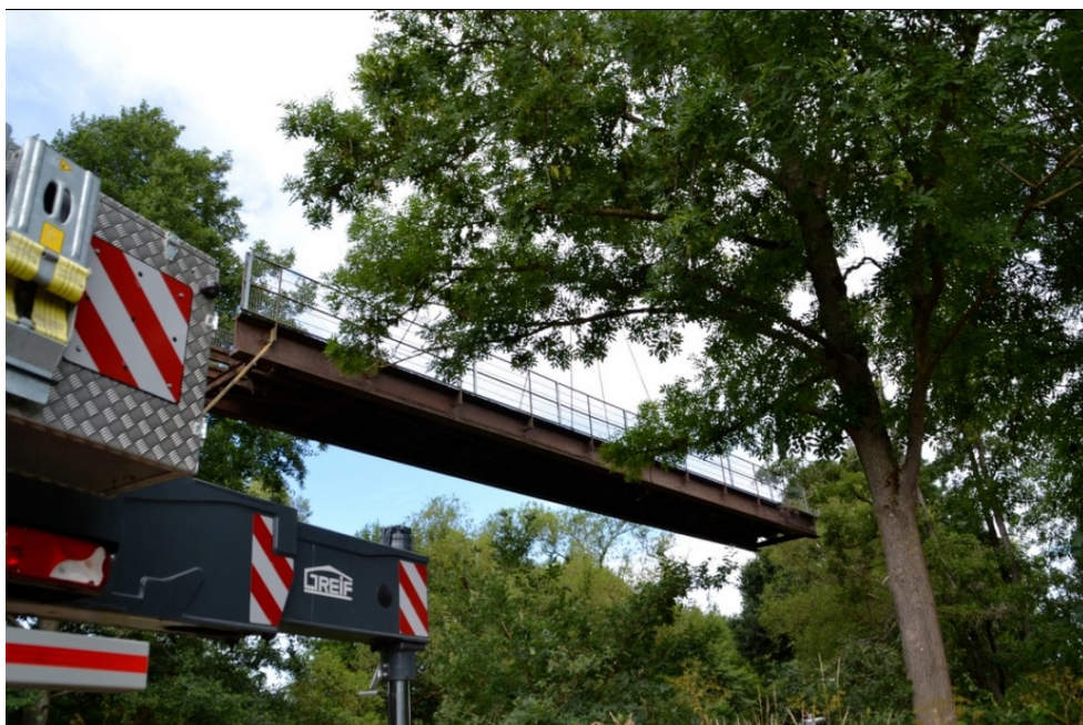
Der Überbau schwebt noch über der Lahn